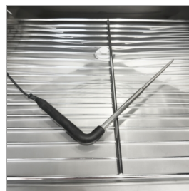
Sonda de núcleo incluida